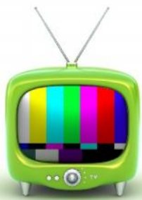
En förening för både radio och TV